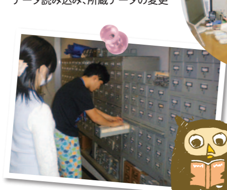
図書カード綴り込み