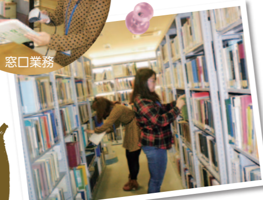
書架整理、揺り動かし