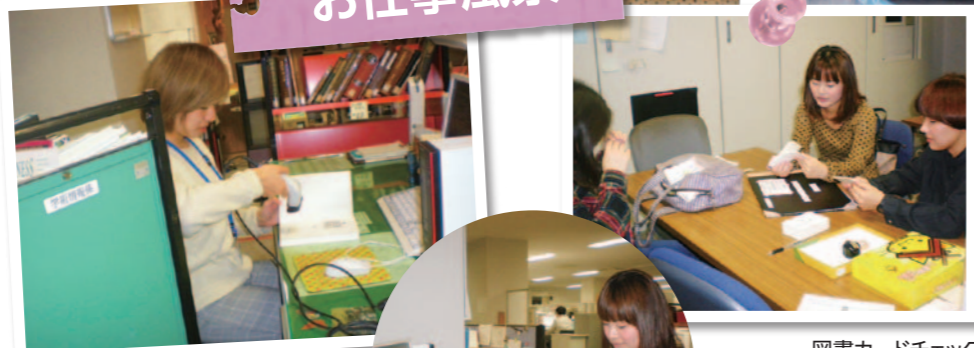
データ読み込み、所蔵データの変更