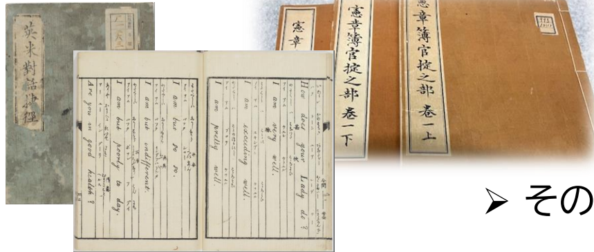
旧制高知高等学校・高知師範学校から継承した資料類